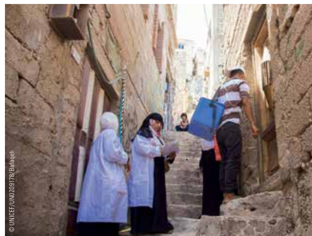
Ein Team geht in Aden von Tür zu Tür, um Cholera-Impfungen durchzuführen.

Ein Netzwerk von ehrenamtlichen Gesundheitsmitarbeitern hilft dabei, auch Kinder in abgelegenen Regionen mit Impfungen zu erreichen.