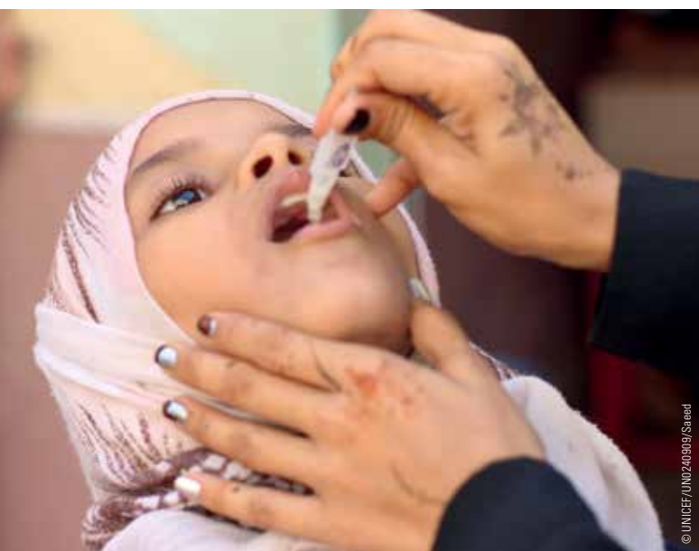
Ein Mädchen im Jemen erhält eine Cholera-Schluckimpfung.

Unter diesen Umständen konnte sich vergangenes Jahr eine Cholera-Epidemie rasend schnell verbreiten. Seit dem Beginn der Epidemie im April 2017 wurden bis einschließlich Ende September 2018 mehr als 1,2 Millionen Verdachtsfälle auf Cholera oder lebensgefährlichen Durchfall gemeldet. Mindestens 2.500 Menschen starben, unter ihnen viele Kinder.