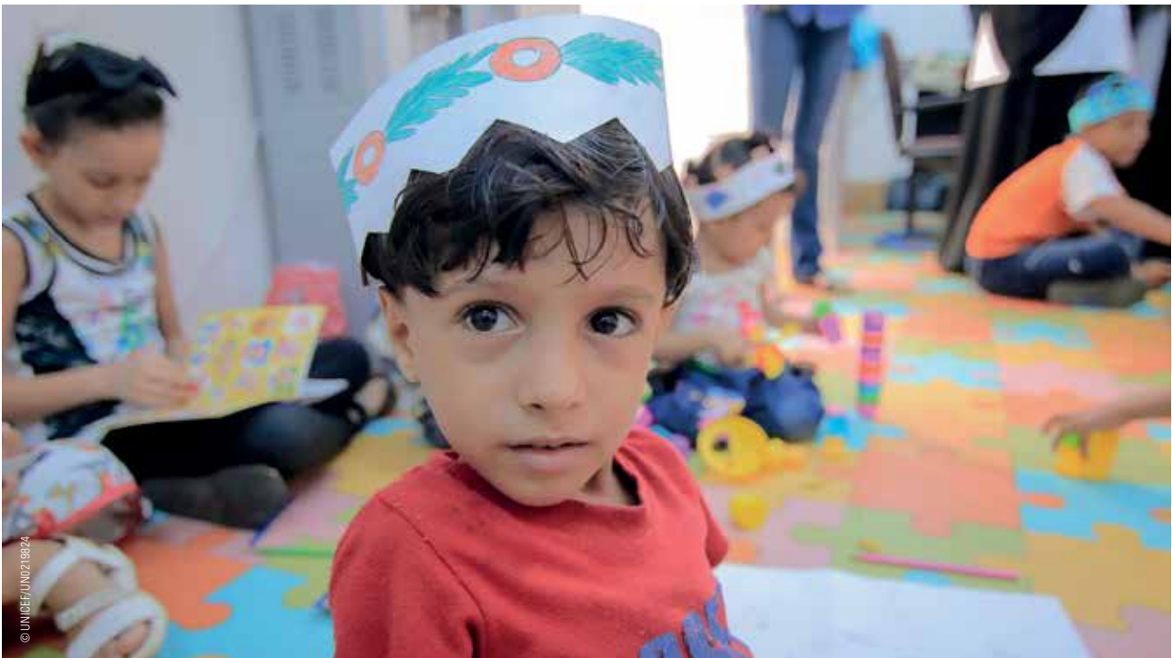
Kinder im Spielzimmer eines Gesundheitszentrums in Aden.

Alle Konfliktparteien im Jemen tragen Verantwortung für die brutale Gewalt gegen Kinder und für die katastrophale humanitäre Situation. UNICEF fordert deshalb erneut alle Konfliktparteien – sowie alle, die Einfluss auf sie haben – dazu auf, Kinder zu schützen und internationales humanitäres Recht zu achten.